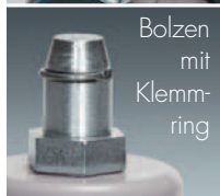
Bolzen mit Klemmring